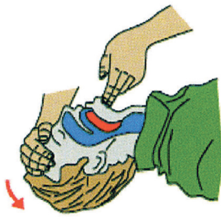
Uvolni dýchací cesty